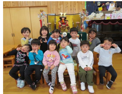
五月人形の前でみんなで写真を撮りました!