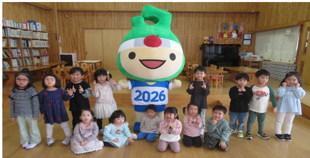
～アップリート君と青のきらめきダンスを踊ったよ!～

最近は普段の生活や遊びの中で、子ども達の優しさに触れることが多く、微笑ましく感じています。おやつ時間、お菓子の袋を開けることができなくて困っている友達を見て、「〇〇があけてあげる」と手伝ったり、トイレの後、脱いだサンダルを「全部揃えて並べたよ」と保育者に教えてくれたりし、頼もしいと思う瞬間でもあります。今月も一人ひとりの成長を喜び合いながら、一日一日を大切にしていきたいと思っています。