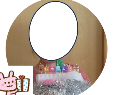
なぎちゃん 5歳 得意なことは トランプで ばばめきをすること