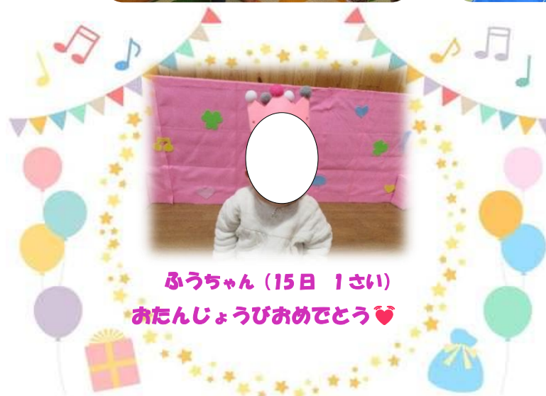
ふうちゃん (15日 1さい) おたんじょうびおめでとう♡